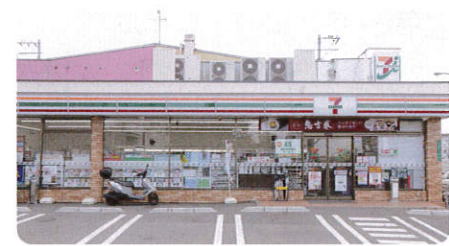
▲セブンイレブン 堺八田西町店