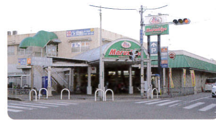
▲スーパーマルシゲ